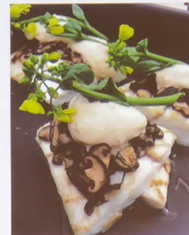
Zalm 60 graden gegaard, tarbot gegrild