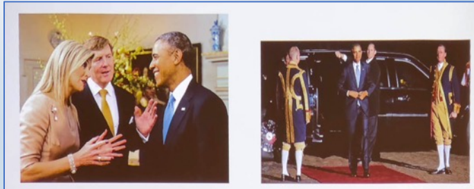
Nuclear Security Summit 2014, Royal Palace Huis ten Bosch on March 24, 2014